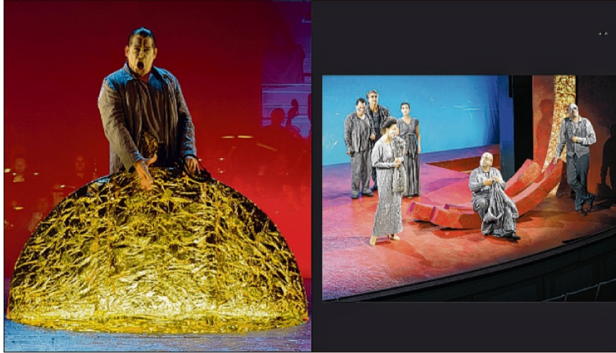
Fotos des Ring-Projekts dokumentieren die Einzigartigkeit der Mindener Inszenierung.